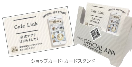
ショップカード・カードスタンド