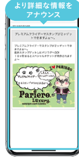
プッシュ通知 詳細画面