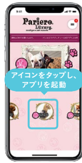
スマートフォン ホーム画面

管理画面からユーザーのスマホのトップ画面にダイレクトに配信ができます! 自動定期配信や配信先の送り分けも可能です。 (例えば、ビールが好きな20代の女性だけに配信等)