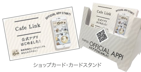
ショップカード・カードスタンド