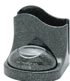
みかげナプキンスタンド付 STR-TM-NP