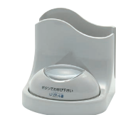
ライトグレーナプキンスタンド付 STR-TG-NP