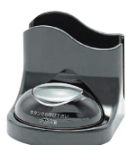
うるしナプキンスタンド付 STR-TU-NP