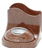
木目ナプキンスタンド付 STR-TW-NP