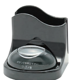
ブラックナプキンスタンド付 STR-TB-NP