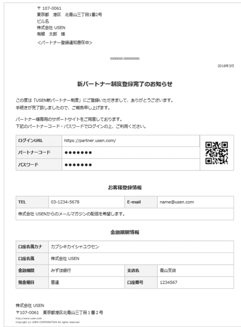
新パートナー制度登録完了のお知らせ