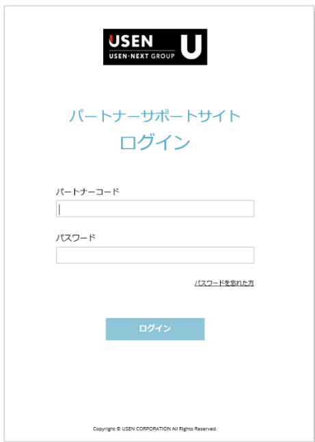
サポートサイト ログインページ

この書面の記載のURL（またはQRコード）でパートナー サポートサイトのログインページ（下図）が開きます。