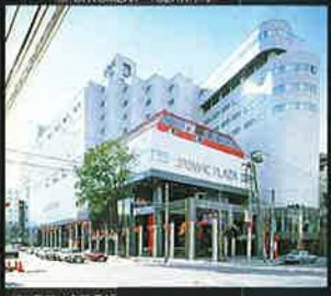
ジャスマックプラザ