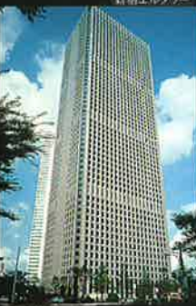
新宿センタービル