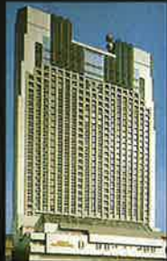
南海サウスタワーホテル大阪