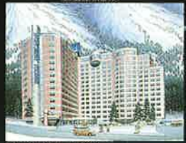
SPORTSMENT YUZAWA 1