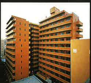
大塚ライオンマンション