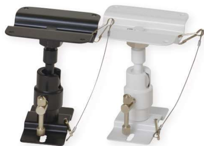
SH-2000 II B/W